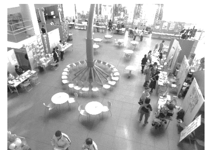
【昨年の応援イベントの様子】