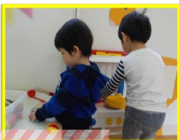
にこにこ園の様子