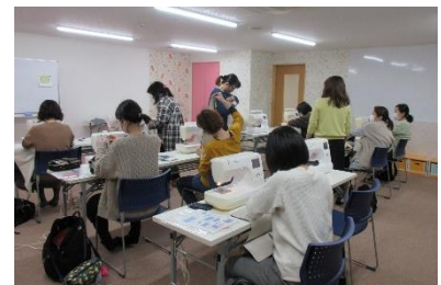
コットンスペース 絵本バック作り