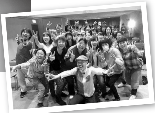
講師とフォーラム参加者との記念撮影