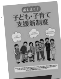
ピンク色のパンフレットが目印です

新制度については、内閣府が発行しているリーフレットが市町村役場や子育てセンターに置かれていますので、是非手にとってみてはいかがでしょうか。